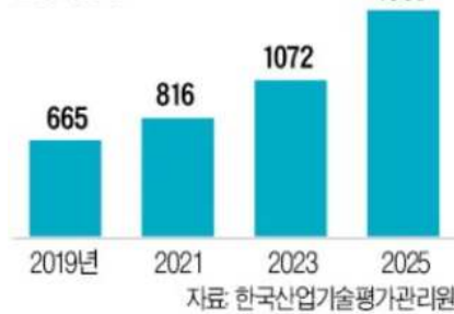
세계 자율운항선박 시장규모 전망치 (단위:억달러)