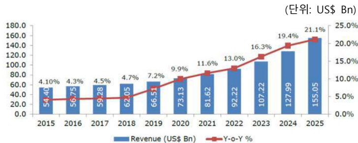
[자율운항선박 세계 시장 수익 및 성장률]