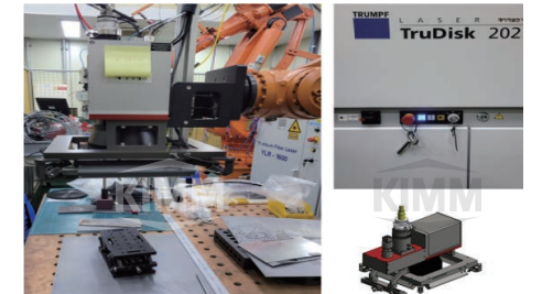
〈 레이저 용접 통합시스템 〉